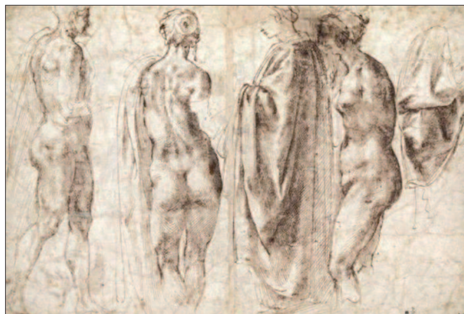
Michelangelo Buonarroti (1475-1564), Estudio de cinco figuras, Museo Condé a Chantilly (Francia)

Tenemos características únicas, como todas las demás especies animales y vegetales. Compartimos algunas de estas características con el resto de lo viviente, ante todo la biofilia, es decir, su tender a la vida, y particularmente con las especies animales más cerca